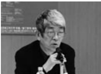
酒井忠康 Tadayasu Sakai

あらゆる表現者において、自分の居場所の本当の意味での効果は、長い時間をかけて自分の仕事に反映されてくるものなのです。