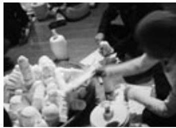
写真9 『DEATH MATCH』(彫刻風土／山形)「展示風景」