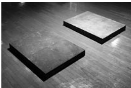
右上から時計回りに 写真4 「Innocence-Angle」 写真5 「Innocence- 国分」 写真6 「Innocence- 冷却パイプより」 写真7 「Innocence-TSUCHI」（部分）