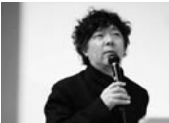
茂木健一郎 Kenichiro Mogi

1962年東京都生まれ。東京大学理学系大学院物理学専攻修士課程修了。理学博士。「クオリア」（感覚の持つ質感）、「アハ体験」（ひらめきの体験）をキーワードとして脳と心の間関係を研究するとともに、文芸評論、美術評論にも取り組んでいる。主な著書に『脳とクオリア』（日経サイエンス社、1997）／『ひらめき脳』（新潮社、2006）など多数。2005年には『脳と仮想』（新潮社、2004）で、第4回小林秀雄賞を受賞。2006年1月よりNHK「プロフェッショナル-仕事の流儀」キャスター。ソニーコンピュータサイエンス研究所シニアリサーチャー。