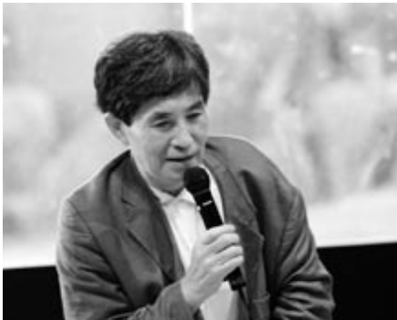
吉増剛造 Gozo Yoshimasu

1939年東京都生まれ。慶應義塾大学国文学卒。詩人。在学中から「三田詩人」「ドラムカン」を中心に旺盛な詩作活動を展開、以後先鋭的な現代詩人として内外で活躍、高い評価を受ける。文学・芸術に関する評論も多い。朗読や現代美術や音楽とのコラボレーション、写真などの活動も意欲的に展開している。主な詩集に『出発』（新芸術社、1964）／『黄金詩篇』（思潮社、1970）高見順賞／『頭脳の塔』（青土社、1971）／『草書で書かれた、川』（思潮社、1977）／『熱風』（中央公論社、1979）／『オシリス、石ノ神』（思潮社、1984）現代詩花椿賞／『螺旋歌』（河出書房新社、1990）詩歌文学館賞／『花火の家の入り口で』（青土社、1995）／『雪の鳥』あるいは『エミリーの幽霊』（集英社、1998）芸術選奨文部大臣賞／『ごろごろ』（毎日新聞社、2004）／『何処にもない木』（試論社、2006）などがある。