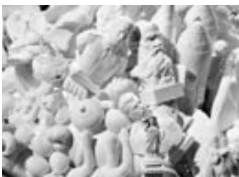
写真10 「Baltic Taste」(部分)