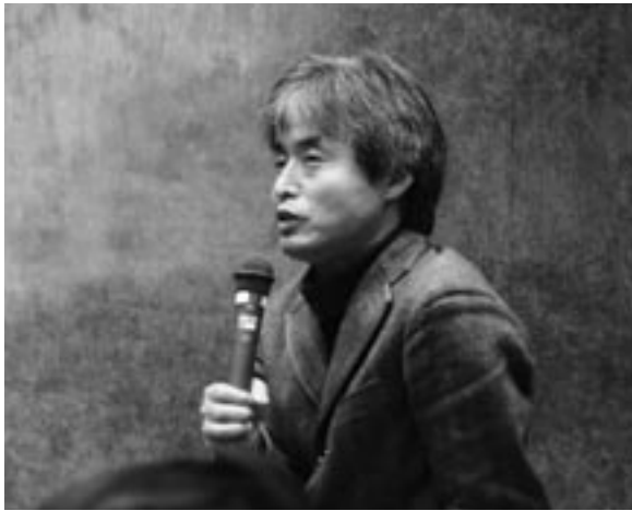
鎌田東二 Toji Kamata

1951年徳島県生まれ。国学院大学神道学博士課程修了。文学博士。宗教哲学者。現在、京都造形芸術大学教授。宗教哲学・民俗学・日本思想史・芸術論など多彩な学問を闊達に横断する。様々なフィールドワークに国内・海外を駆け巡る研究即実践の行動派。学者やアーティストとの幅広い交流をもとに、広く一般に向けた霊性に基づく学問と芸術の探究の場 NPO 法人東京自由大学の運営や伊勢・猿田彦神社「おひらきまつり」など文化創造活動にも取組む。法螺貝・石笛奏者で、ギター片手に自作の歌も歌う自称「神道ソングライター」。主な著書に『翁童論4部作』（新曜社、1988～2000）／『神と仏の精神史』（春秋社、2000）／『神道のスピリチュアリティ』（作品社、2003）／『霊性の文学誌』（作品社、2005）、編著に『謎のサルタヒコ』（創元社、1997）／『ケルトと日本』（角川書店、2000）他。近著に『霊的人間』（平凡社、2006）など。