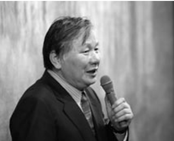
松本哲男 Tetsuo Matsumoto

1943年栃木県生まれ。宇都宮大学教育学部卒、日本画家塚原哲夫氏に師事。93年4月～東北芸術工科大学芸術学部美術科(日本画コース)助教授。96年4月～東北芸術工科大学芸術学部美術科(日本画コース)教授。現在、東北芸術工科大学学長。日本美術院評議員。72年日本美術院院友に推挙される。今野忠一氏に師事する。主な受賞に、74年再興第59回院展で日本美術院賞・大観賞。日本美術院特待。83年日本美術院同人。84年芸術選奨文部大臣新人賞。89年再興第74回院展文部大臣賞。93年再興第78回院展内閣総理大臣賞。94年栃木県文化功労賞など。